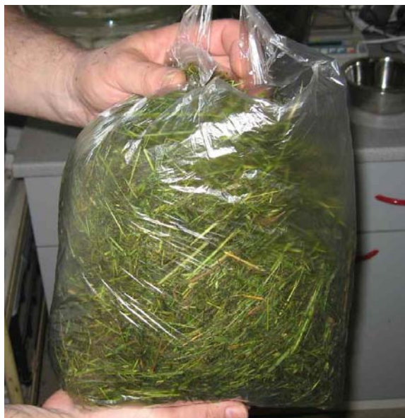
Obr. 2: Pohled na přípravu minisenáží o hmotnosti cca 1 kg

Ztráty vlivem silážování jsme prováděli pomocí technologie minisenáží. Technologie minisenáží je registrována jako uplatněná technologie dle RIV. Jedná se vzorky s hmotností cca 1 kg. Tyto jsou stlačeny a obaleny průtahovou fólií podobně jako senážní balíky. Standardní doba laboratorní fermentace je 90 dní při teplotě 25°C. Pro účely pokusů a stanovení vlivu délky silážování na produkci bioplynu byly vzorky silážovány alternativně 10, 90, 180 a 365 dnů. U vzorků byly provedeny standardní laboratorní rozborů.