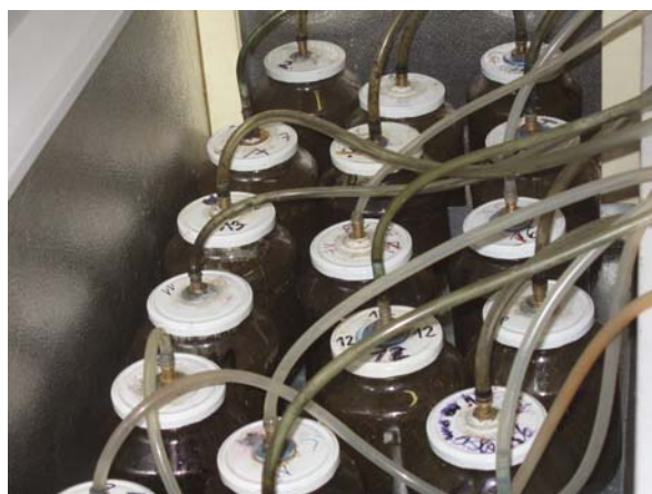
Obr. 5: Malé fermentory v termoboxu.

Z jednotlivých typů siláží byly při stejných režimech anaerobní fermentace zjišťovány produkce bioplynu a jeho chemické složení. Pro výrobu bioplynu ze speciálních substrátů bylo upraveno laboratorní pracoviště. V laboratorních pokusech určujeme vhodné směsi biomasy pro výrobu bioplynu na malých zařízeních o objemu 2 l s vsázkou 1 kg směšného materiálu. Sada fermentorů je ve vyhříváném termoboxu. Každý fermentor má svůj plynoměr pro odečet produkce bioplynu a plynojem pro analýzu složení plynu.