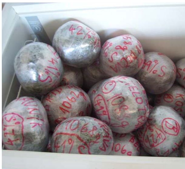
Obr. 3: Minisenáže v termobou