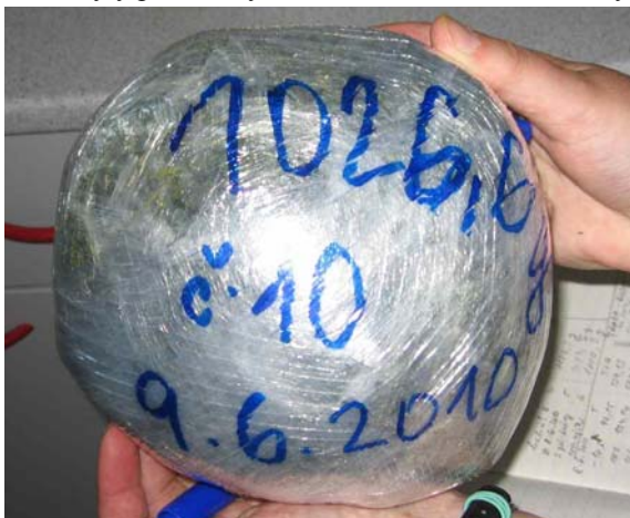
Obr. 1: Vzorek minisenáže