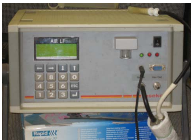
Obr. 4: Používaný analyzátor plynu Air LF