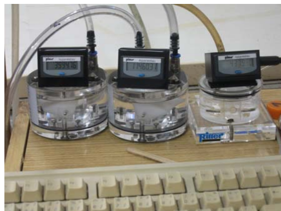
Obr. 6: Měření množství plynu pomocí nízkoprůtokových plynometrů

Kys. máselná - její úroveň nedosáhla hodnoty 1,0 g/kg, která je již považována za limitní hodnotu z hlediska kvality .