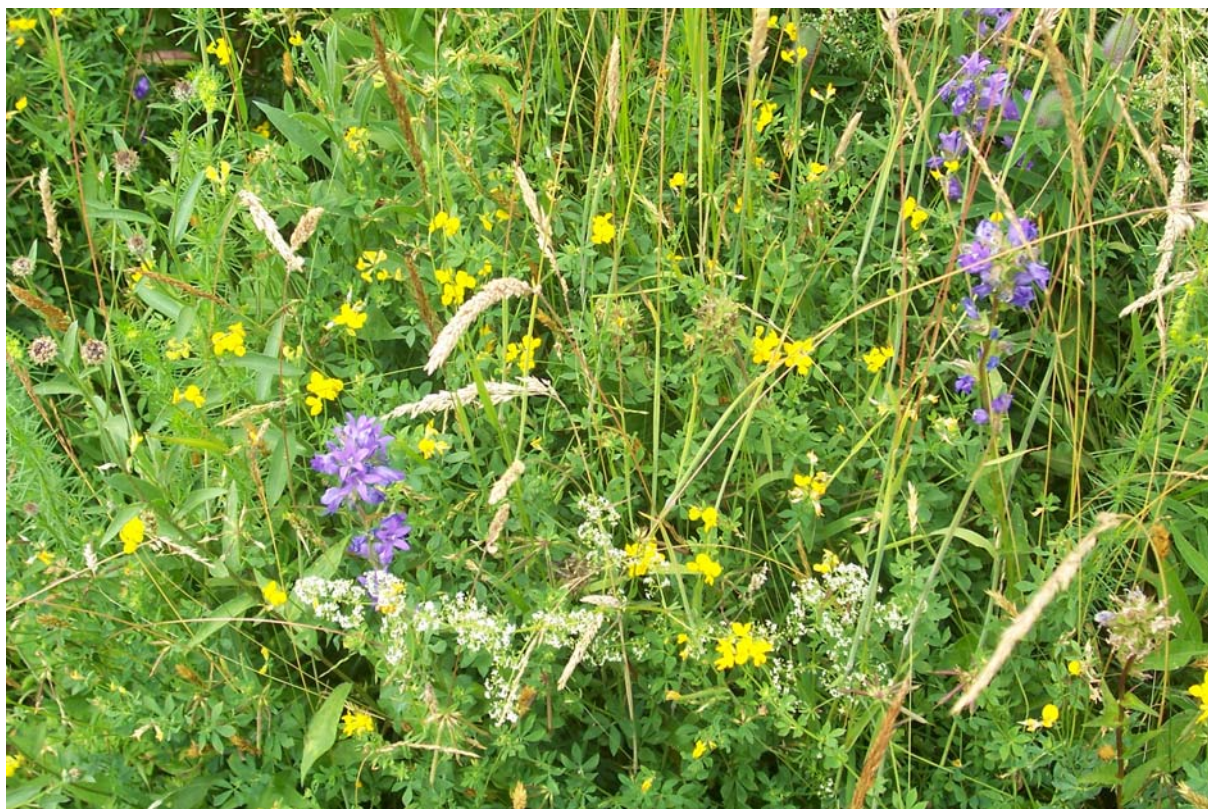
Obr. 1: Květnatá louka pro výzkum produkce bioplynu