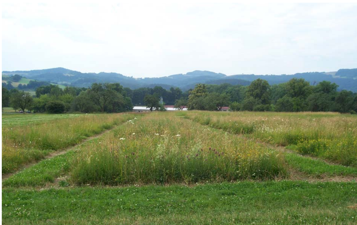
Obr. 2: Pokusy s lučními směsmi s vysokou druhovou diverzitou na stanovišti v Zubří